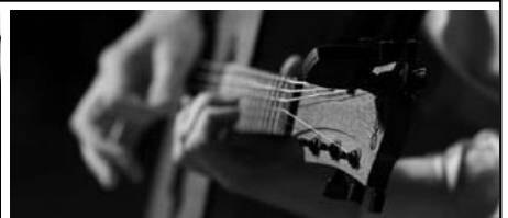
Kultur und Freizeit