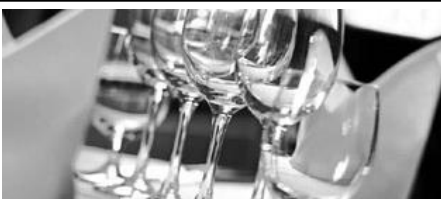
Hotel und Restaurant