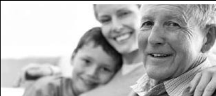
Wohnen im Alter